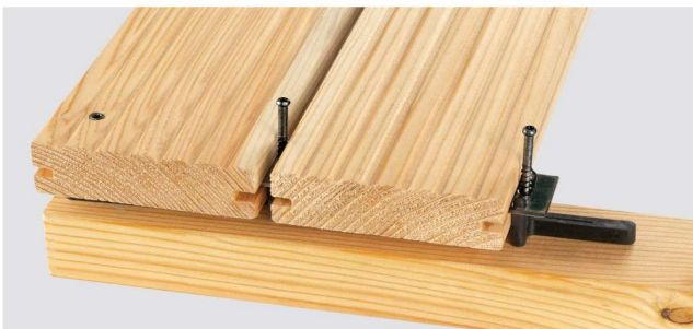
Die nächsten Dielen ansetzen, ausrichten, fixieren und mit der vorherigen Diele verschrauben. Achten Sie auf die richtige Drehmomenteinstellung Ihres Montagewerkzeuges. Schrauben nicht überdrehen. Ein Nachjustieren ist jederzeit möglich.