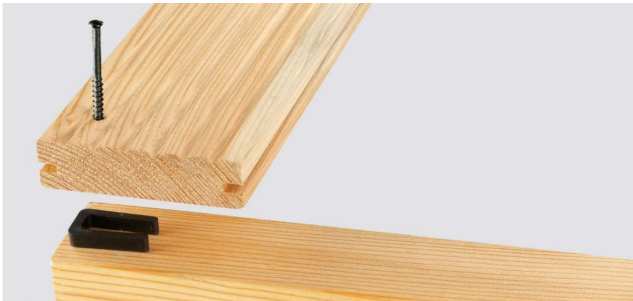
Anfangs/Abschluss-GECKO als Abstandshalter unter die erste Diele setzen. Der Quersteg muss nach oben zeigen. Anfangsdielen vorbohren.