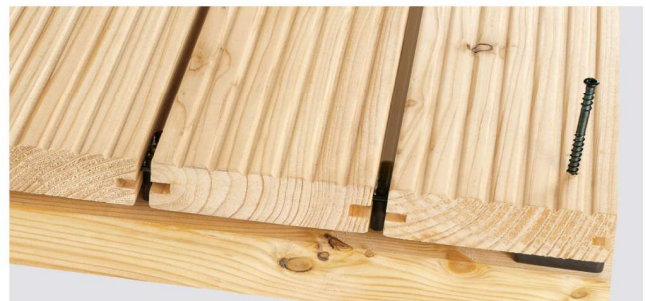
Anfangs/Abschluss-GECKO als Abstandshalter unter die letzte Diele setzen. Abschluss-Diele vorbohren und verschrauben.

Wichtig: Entfernen Sie sorgfältig alle Metallspäne vom Bohren oder Flexen vom Belag. Diese können in Verbindung mit Feuchtigkeit Verfärbungen auf Ihrem Belag erzeugen.