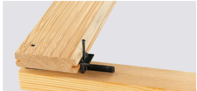
Systemteil in die Nut der Holzdielen einsetzen. Schraube zum Fixieren etwas eindrehen.