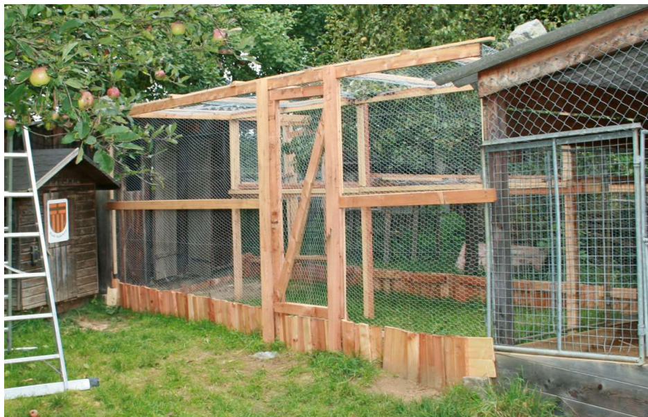
Anwendungsbeispiel: Hasenstall (von Kindern gebaut)