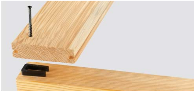
Anfangs/Abschluss-GECKO als Abstandshalter unter die erste Diele setzen. Der Quersteg muss nach oben zeigen. Anfangsdielen vorbohren.