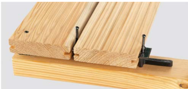
Die nächsten Dielen ansetzen, ausrichten, fixieren und mit der vorherigen Diele verschrauben. Achten Sie auf die richtige Drehmomenteinstellung Ihres Montagewerkzeuges. Schrauben nicht überdrehen. Ein Nachjustieren ist jederzeit möglich.