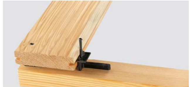
Systemteil in die Nut der Holzdielen einsetzen. Schraube zum Fixieren etwas eindrehen.