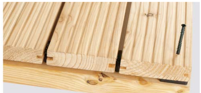
Anfangs/Abschluss-GECKO als Abstandshalter unter die letzte Diele setzen. Abschluss-Diele vorbohren und verschrauben.

Wichtig: Entfernen Sie sorgfältig alle Metallspäne vom Bohren oder Flexen vom Belag. Diese können in Verbindung mit Feuchtigkeit Verfärbungen auf Ihrem Belag erzeugen.